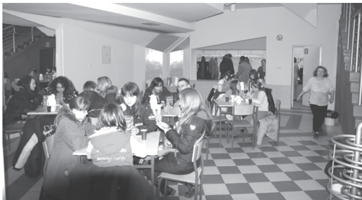
W Strzeleckim Ośrodku Kultury mieścił się sztab WOŚP