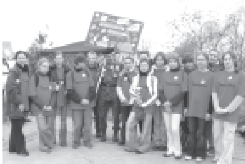
Drużyna „Czerwone Żubryki”

W pierwszą sobotę listopada na terenie Parku Wiejskiego w Raszowej spotkali się uczestnicy XLI Rajdu „Pożegnanie jesieni”.