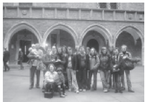
Wjazd do Krakowa? Warto skorzystać z pomysłu, nim skończy się zima i zaczną matury.