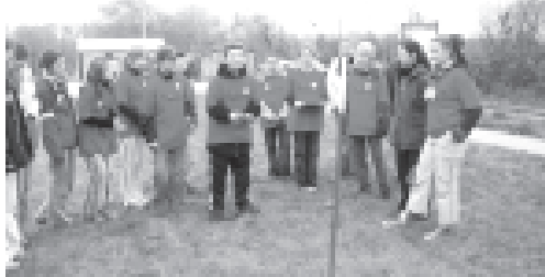
Jedna z rajdowych konkurencji (rzut ringo)

Istota umysłu sprowadza się do tego, by o zwycięstwie decydowała siła umysłu