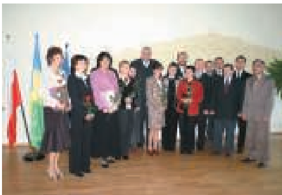
O nagrodach Starosty Strzeleckiego dla nauczycieli, czytaj str. 5