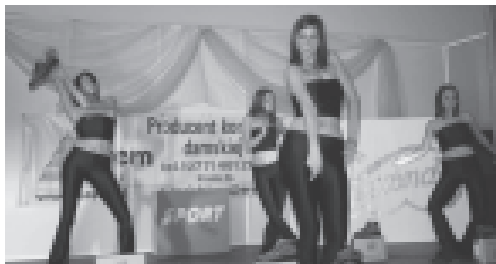
Inne piękne dziewczyny prezentowały obuwie... ochronne

Nie była to zresztą jedyna nagroda o jaką ubiegali się uczestnicy – najlepsza oferta wystawiennicza została wyróżniona Nagrodą Burmistrza Strzelec Opolskich, a nagrodę otrzymała firma Interplast Burcek, ze Strzelec Opolskich – producent stolarki budowlanej okien, drzwi, rolet z PCV i drewna.