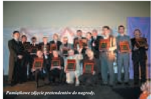
Pamiątkowe zdjęcie pretendentów do nagrody.