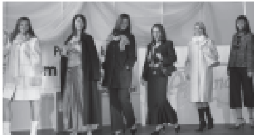
Pokaz mody strojów na każdą okazję.

Wystawcy wykorzystywali wszystkie formy reklamy. Najchętniej jednak organizowali pokazy z udziałem modelek.